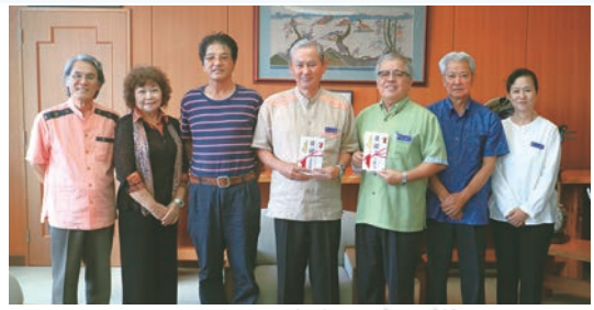
ユンタンザ歌の会 様