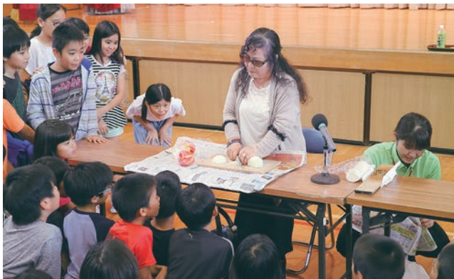
福祉教育のようす