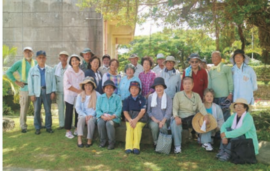
古堅永光会の会員の皆さま