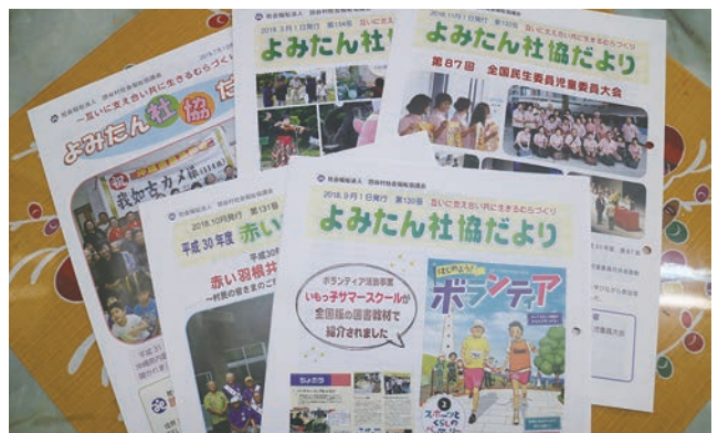
よみたん社協だより発行