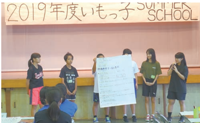
中高生のボランティア研修会