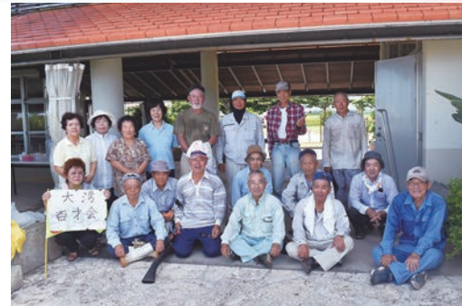
大湾百才会の会員の皆さま