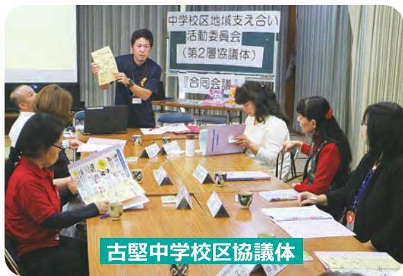
古堅中学校区協議体

委員として、支え合い委員会の代表、障がい・児童・老人分野の専門職、村内企業、一般村民、行政職員、社協職員で第2層協議体を実施し、今年度は第3層協議体の活動報告と個人、企業が独自で行っている活動情報交換、フードバンクの活用について意見交換会を実施しています。