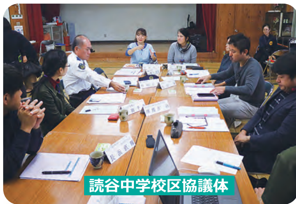
読谷中学校区協議体