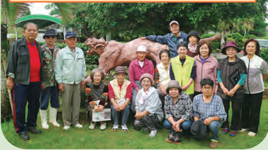
儀間光命会の皆さん(2月)