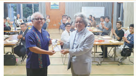
読谷やちむん市実行委員会 様