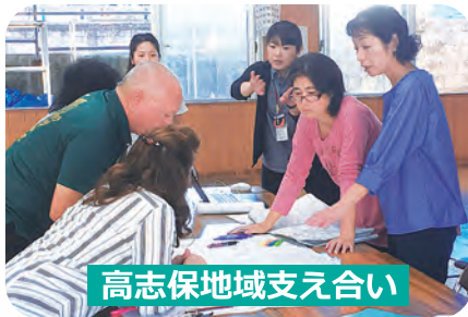
高志保地域支え合い