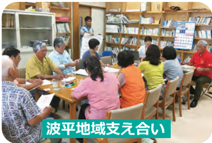
波平地域支え合い

『地域支え合い体制づくり推進事業（住み慣れた地域で出来るだけ長く安心して暮らせる地域づくり）』に基づき、地域に住む人同士が日常生活の中でいつもと違う様子に気づく事が出来、緊急時の連絡体制づくりや困りごとの解決に向けての手だてについて考える活動が出来るよう、時には支える側、支えられる側として、総合的な支え合いの体制づくりを図ることを目的として活動しています。平成30年度は「高志保」「波平」「上地」が新しく立ち上がり村内14の自治会で活動しています。