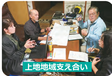
上地地域支え合い