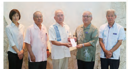
読谷村軍用地主会 様